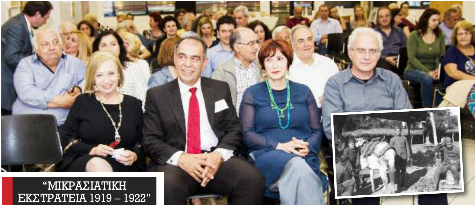
“ΜΙΚΡΑΣΙΑΤΙΚΗ ΕΚΣΤΡΑΤΕΙΑ 1919 – 1922”