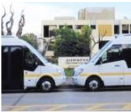
ΔΗΜΟΣ ΠΑΠΑΓΟΥ - ΧΟΛΑΡΓΟΥ