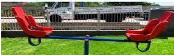
Φωτογραφία 5. Κατάλληλη τραμπάλα

- Το πολυόργανο (ξύλινη κατασκευή που ανέβαιναν τα παιδιά και είχε πλαστική τσουλήθρα και μια μικρή σκάλα), κρίθηκε εντελώς ακατάλληλο , αφού είχαν σαπίσει τα ξύλα και ήταν πολύ επικίνδυνο για τα παιδιά και αφαιρέθηκε τελείως (επισυνάπτεται φωτογραφία 6 με το άδειο πλέον χώρο).