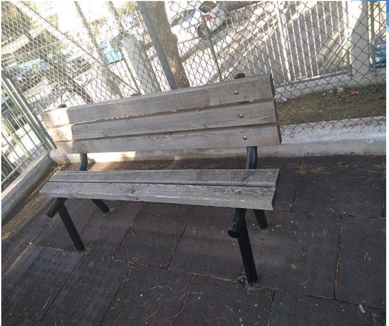
Φωτογραφία 7. Ακατάλληλο παγκάκι, λείπει μία ράβδος

- Οι μπασκέτες (φωτογραφία 8) στο προαύλιο επισκευάστηκαν με δωρεά και τρίφτηκαν, περάστηκαν μίνιο και βάφτηκαν από εθελοντική εργασία γονέων και εθελοντών.