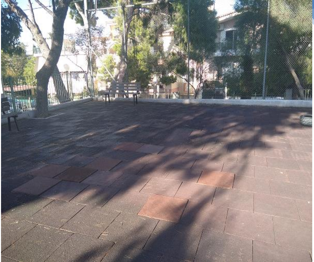
Φωτογραφία 6. Χώρος που ήταν το πολυόργανο