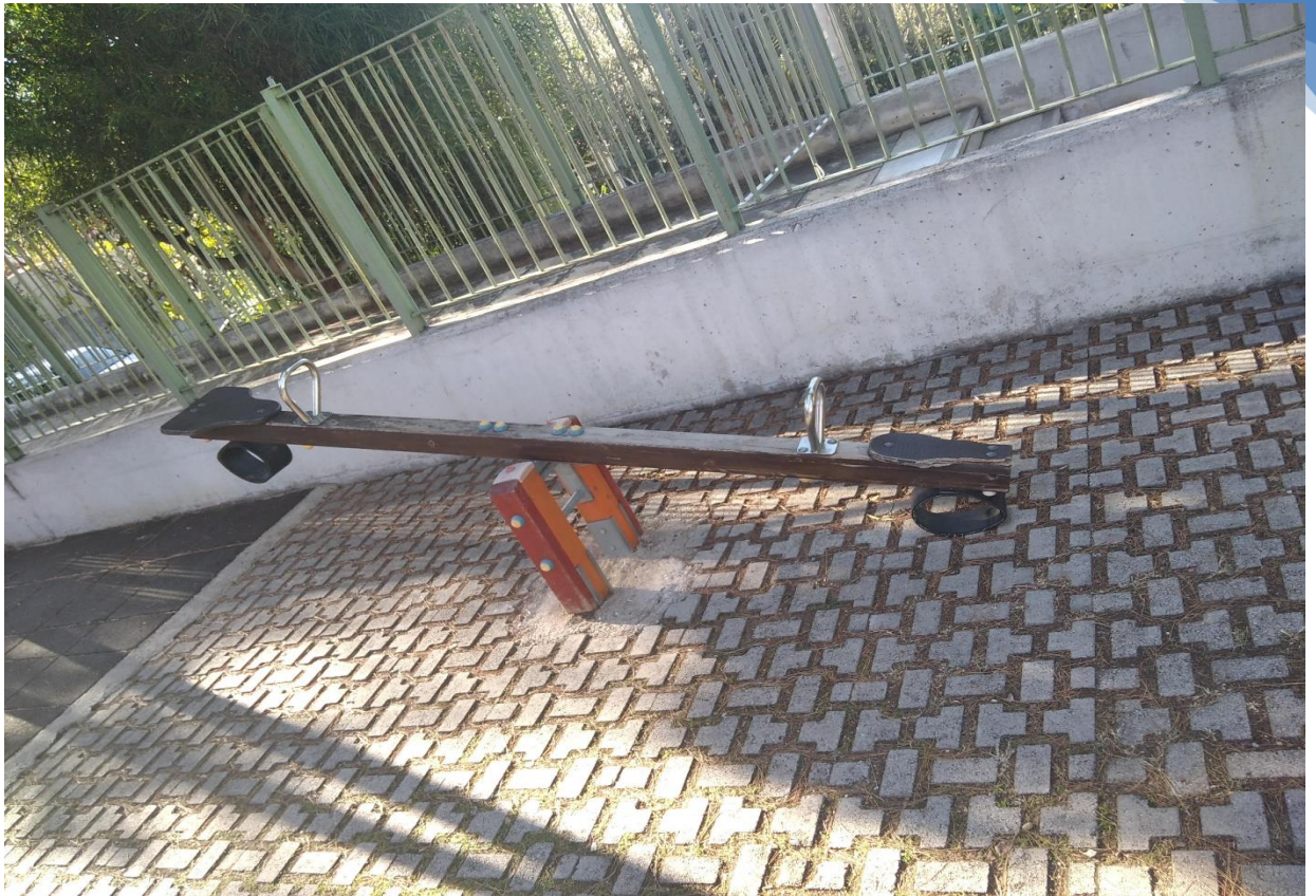
Φωτογραφία 4. Ακατάλληλη τραμπάλα