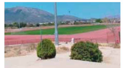
Αγώνες δρόμου φυσικών εμποδίων στο ανοικτό στάδιο του Ολυμπιονίκη Γ. Σ. Παπασιδέρη