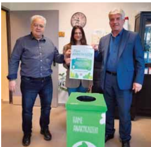
Συμμετέχουν μαζικά στον μαραθώνιο ανακύκλωσης Followgreen 2023 – 2024